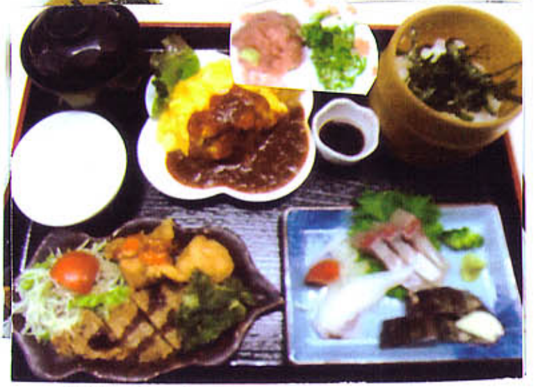
スイカ定食 20,000円 1,800円のもあります