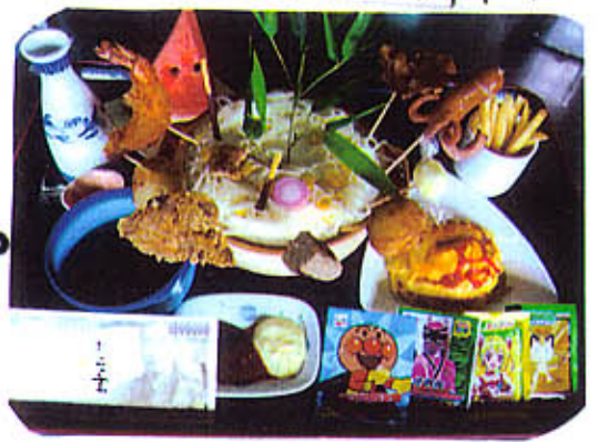
おし. 様ランチ ツヤモ 1000円 ジュースはトックリ